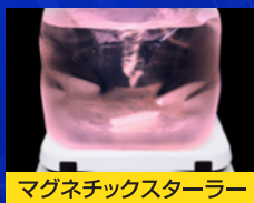
マグネチックスターラー

本体のみで自立する高強度設計により、かくはん作業をガラス容器に移し替えることなく行なえます。立方体形状により、溶液のかくはん時の溶解効率が高く、粉体培地の調整も短時間で可能。